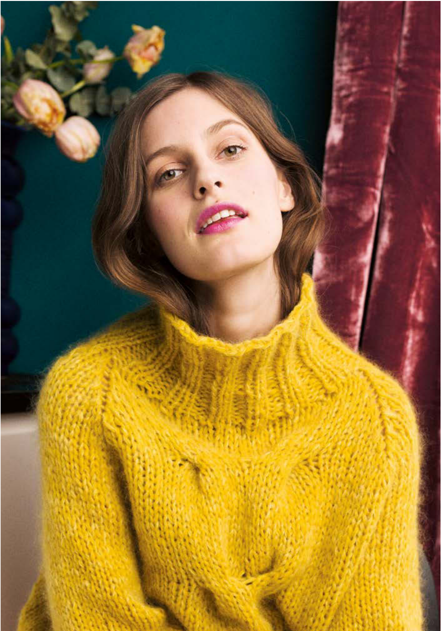
264-11 Raglangenser med flette i Puno og dobbel Plum